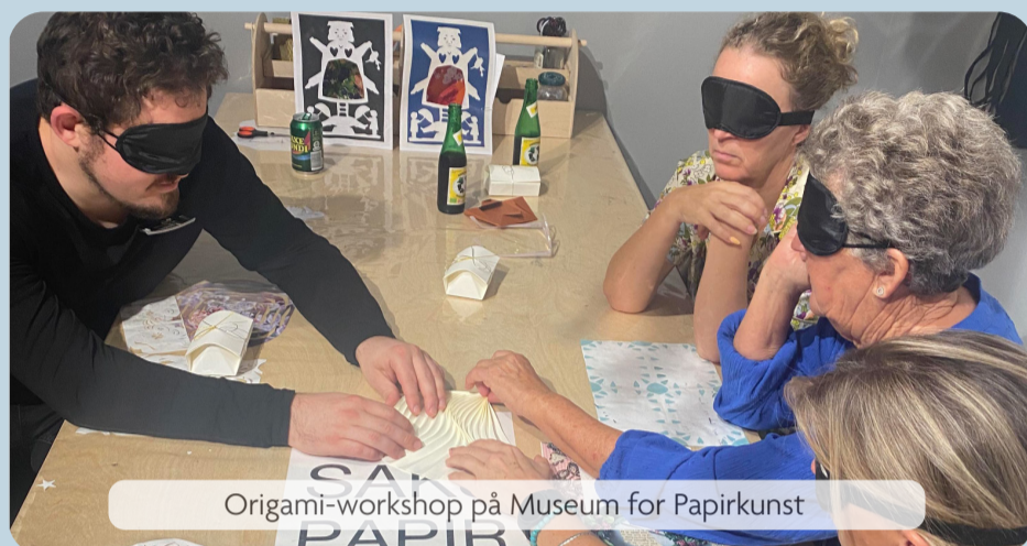
Origami-workshop på Museum for Papirkunst