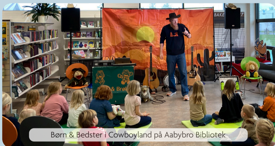
Børn & Bedster i Cowboyland på Aabybro Bibliotek