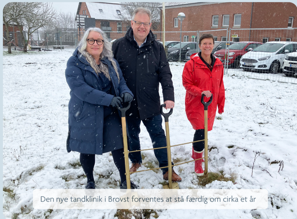
Den nye tandklinik i Brovst forventes at stå færdig om cirka et år

“Vi ser frem til et arbejdsmiljø helt i top med tidssvarende rammer, og så glæder vi til at gøre tre kulturer til én - at blive én stor flok kolleger,” siger hun.