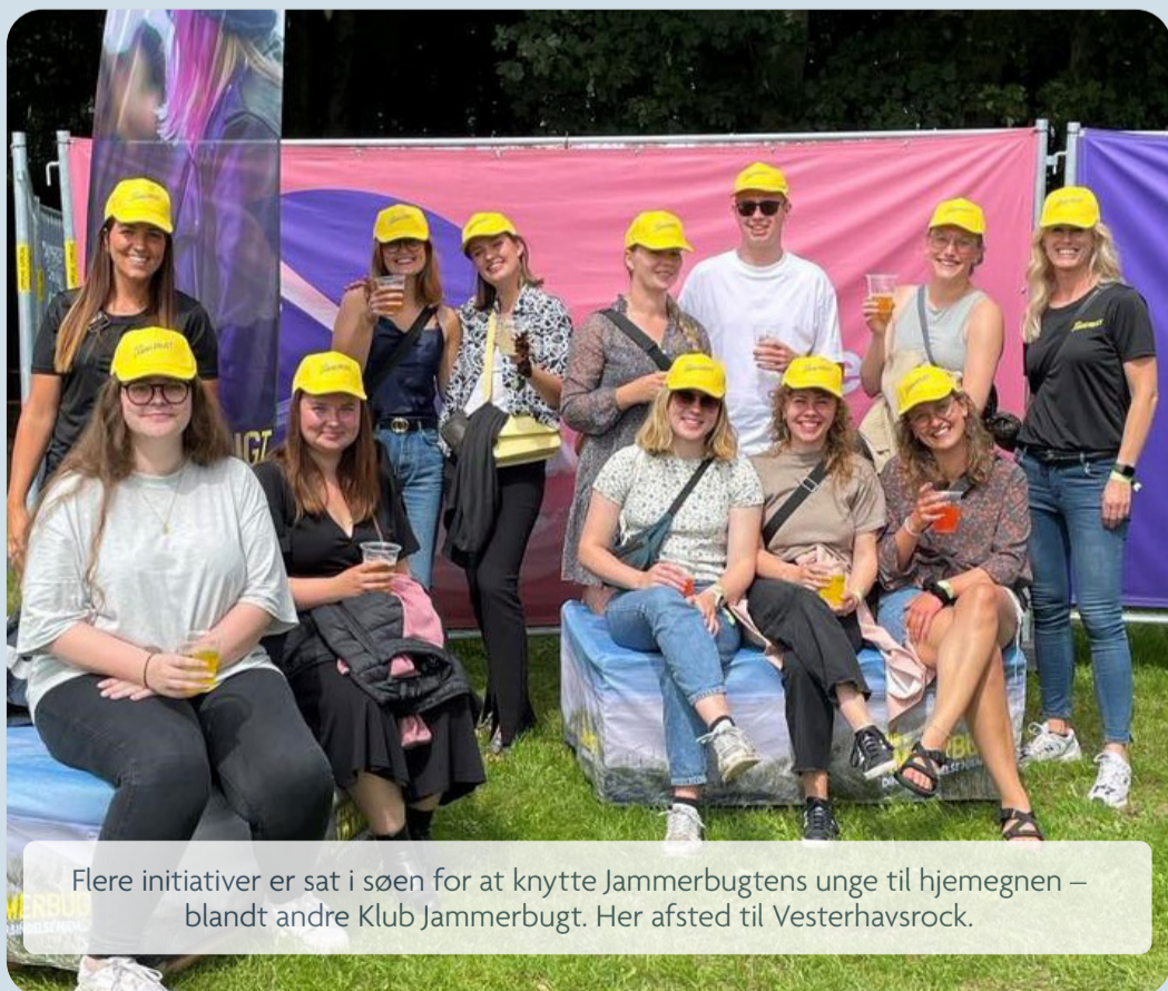
Flere initiativer er sat i søen for at knytte Jammerbugtens unge til hjemegnen – blandt andre Klub Jammerbugt. Her afsted til Vesterhavsrock.