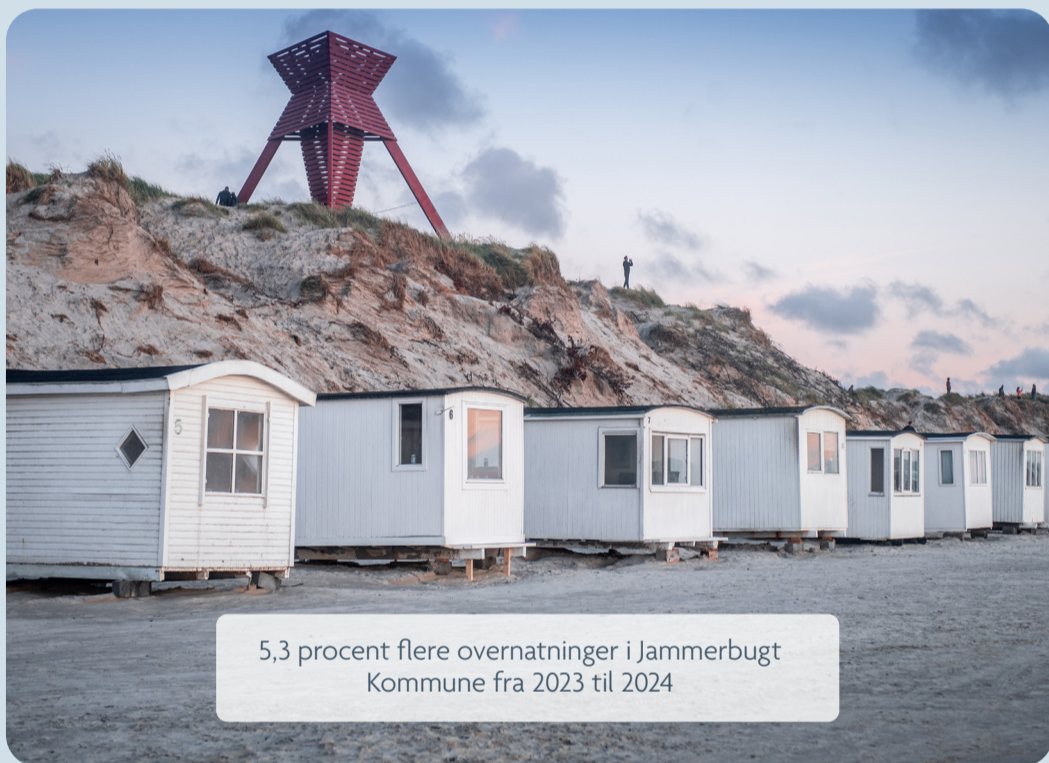
5,3 procent flere overnatninger i Jammerbugt Kommune fra 2023 til 2024