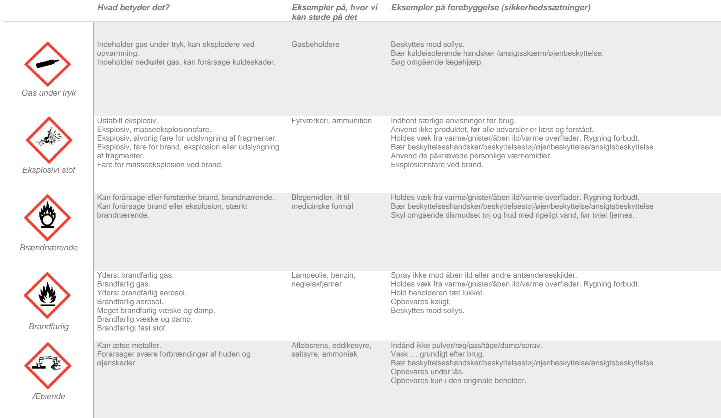
Gas under tryk