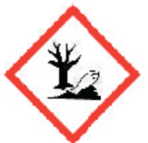
Farligt for miljøet

I tilfælde af indtagelse: Ring omgående til en GIFTINFORMATION eller en læge. Fremkald IKKE opkastning. Opbevares under lås. Indånd ikke pulver/røg/gas/tåge/damp/spray. Vask ... grundigt efter brug. Der må ikke spises, drikkes eller ryges under brugen af dette produkt. Søg lægehjælp ved ubehag. Ved eksponering: Ring til en GIFTINFORMATION eller en læge. Indhent særlige anvisninger før brug. Anvend ikke produktet, før alle advarsler er læst og forstået. Anvend de påkrævede personlige værnemidler. Ved eksponering eller mistanke om eksponering: Søg lægehjælp. Undgå indånding af pulver/røg/gas/tåge/damp/spray. Ved utilstrækkelig udluftning anvendes åndedrætsværn. Ved indånding: Ved vejtrækningsbesvær: Flyt personen til et sted med frisk luft og sørg for, at vedkommende hviler i en stilling, som letter vejtrækningen