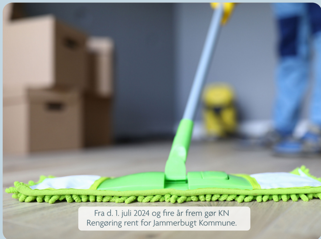
Fra d. 1. juli 2024 og fire år frem gør KN Rengøring rent for Jammerbugt Kommune.

De indkomne tilbud viste en årlig millionbesparelse sammenlignet med hjemtagning af rengøringsområdet, og der var flertal for en fortsat udlicitering. Valget faldt i henhold til de udstukne kriterier efterfølgende på KN Rengøring fra Pandrup, hvis tilbud desuden indebærer en væsentlig stigning i antallet af timer til opgaven, i forhold til den tidligere aftale.