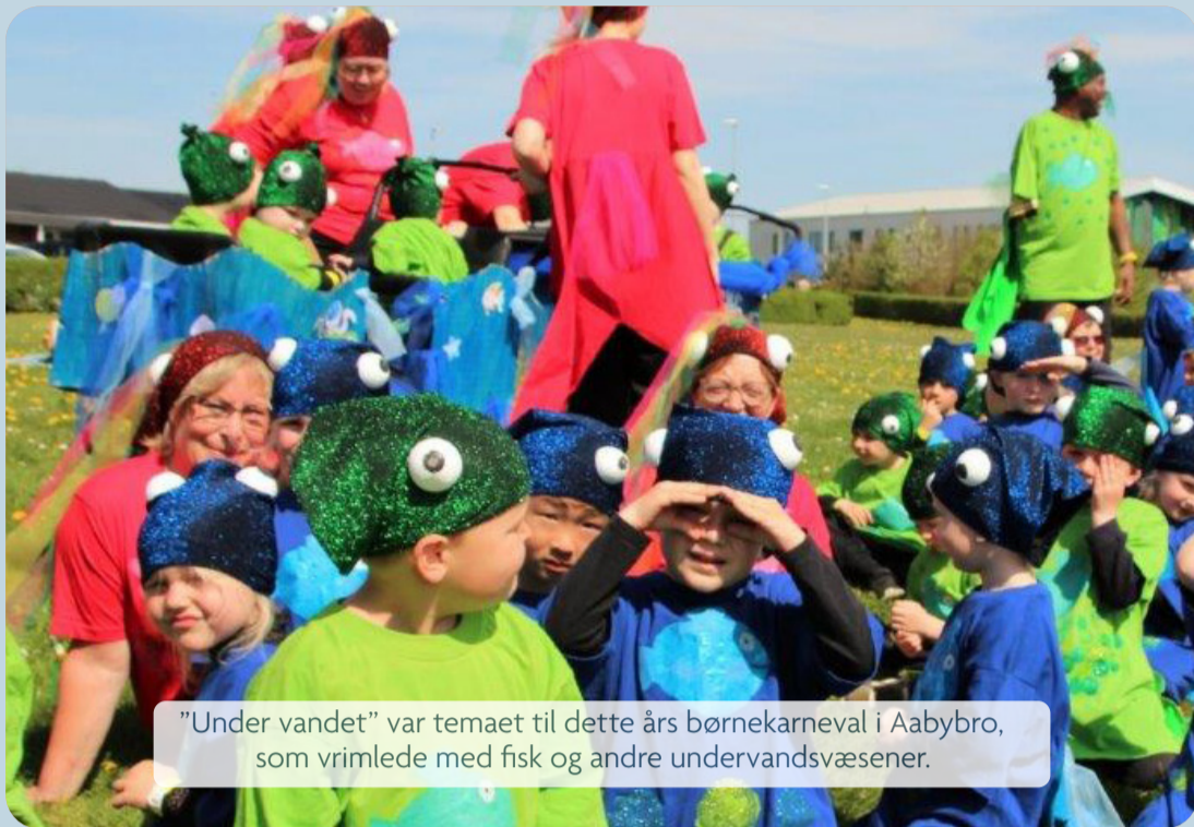
"Under vandet" var temaet til dette års børnekarneval i Aabybro, som vrimlede med fisk og andre undervandsvæsener.