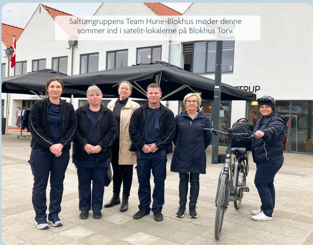
Saltumgruppens Team Hune-Blokhushus møder denne sommer ind i satellit-lokalerne på Blokhushus Torv.