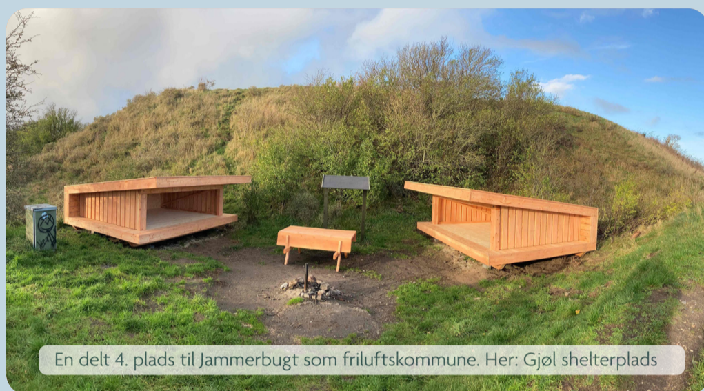
En delt 4. plads til Jammerbugt som friluftskommune. Her: Gjøøl shelterplads