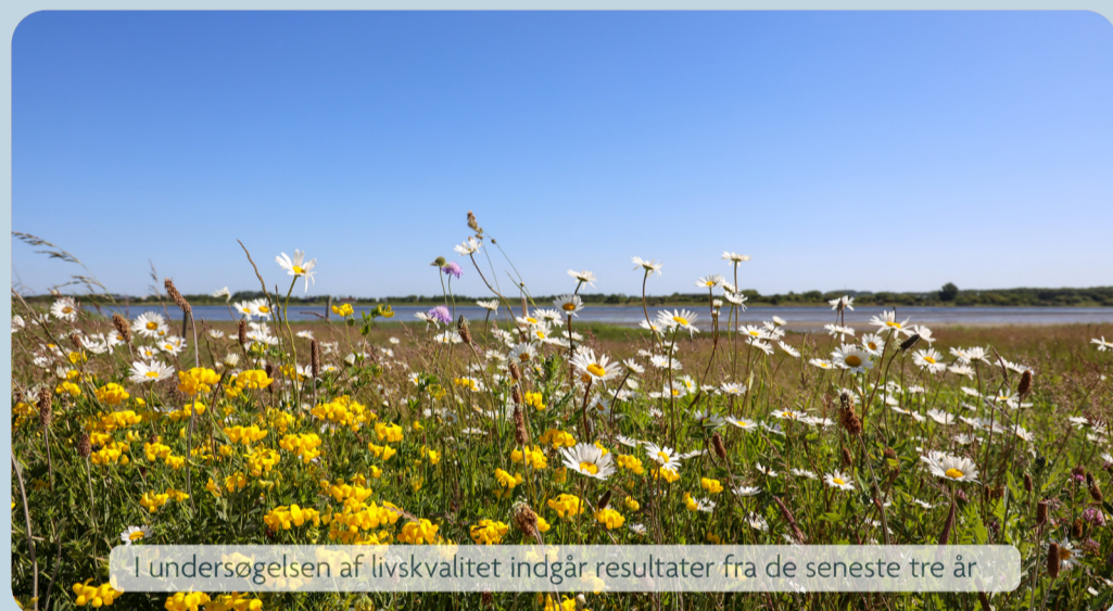
I undersøgelsen af livskvalitet indgår resultater fra de seneste tre år