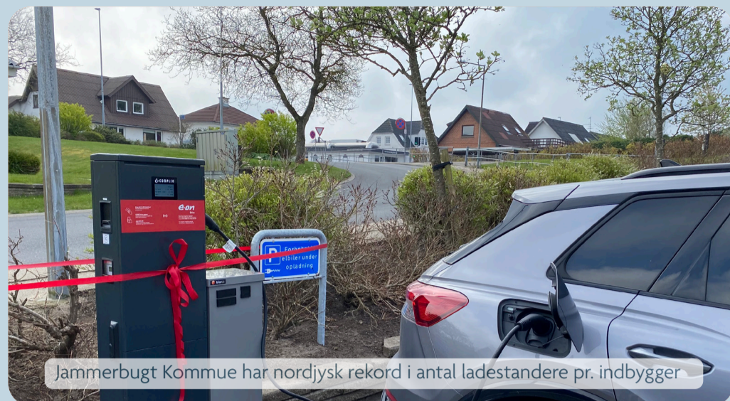
Jammerbugt Kommune har nordjysk rekord i antal ladestandere pr. indbygger

Undersøgelsen baserer sig på svar fra 7399 interviews blandt danskere over 25 år, indsamlet fra 1. marts til 13. marts 2023. I afsnittet om livskvalitet indgår dog resultaterne fra både 2021, 2022 og 2023 og dermed 21.659 besvarelser alt.