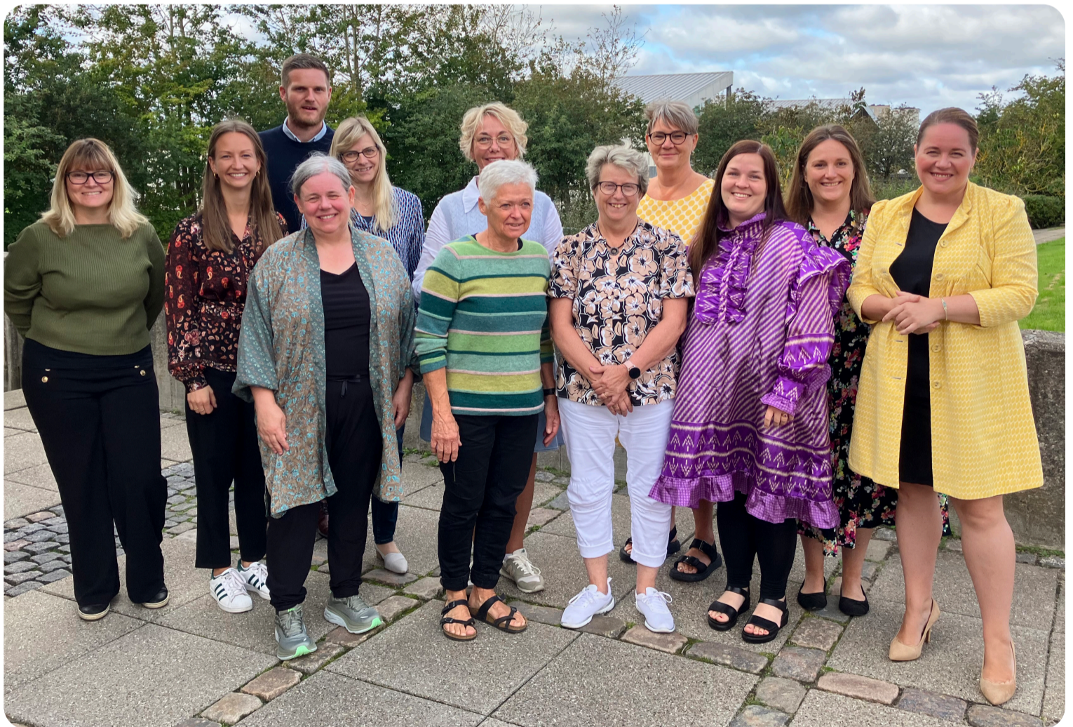
12 af HR-afdelingens 17 medarbejdere. Afdelingen er en del af staben og holder til på rådhuset i Aabybro

”I Jammerbugt Kommune mangler vi, ligesom mange andre steder, medarbejdere. Vi har stillinger, som vi har svært ved besætte: SOSU’er, ingeniører, tandlæger, skolepsykologer og IT-folk. Som kommune er vi derfor nødt til at forsøge at gøre noget særligt Jammerbugt’sk, som kandidater vil rejse efter. Vi har et super spændende og vigtigt stykke arbejde foran os.