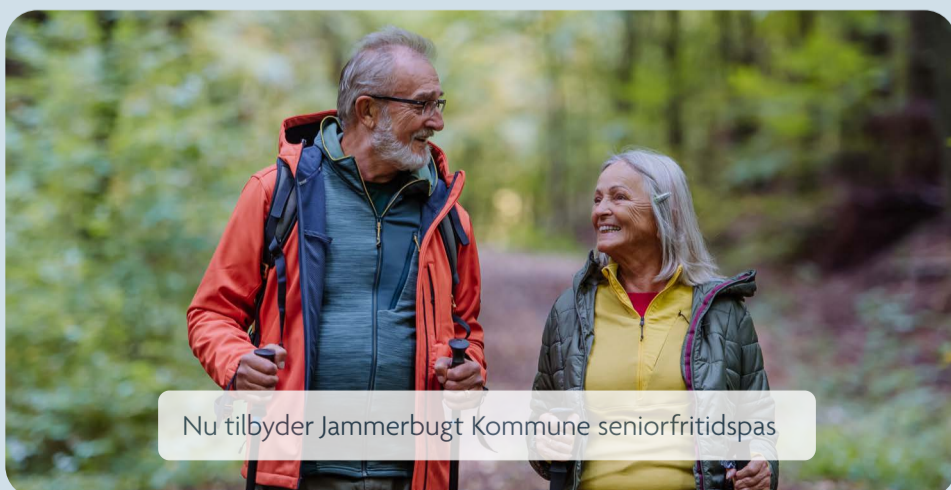
Nu tilbyder Jammerbugt Kommune seniorfritidspas