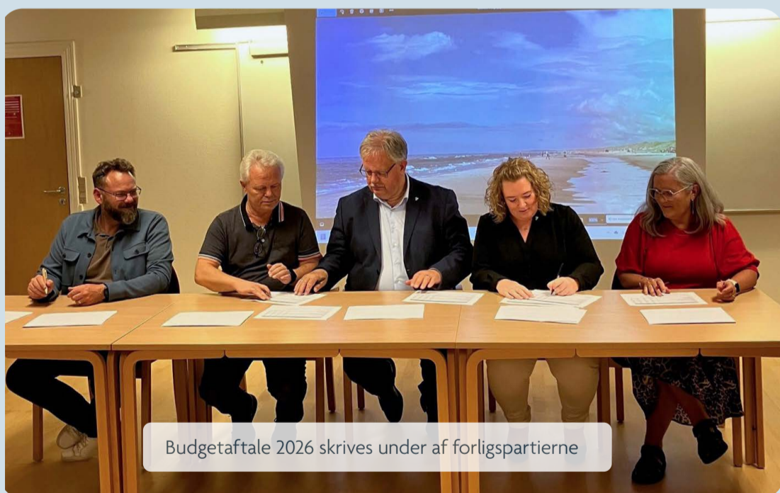
Budgetaftale 2026 skrives under af forligspartierne