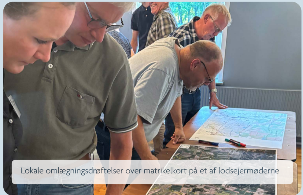
Lokale omlægningsdrøftelser over matrikelkort på et af lodsejermøderne

Inden årsskiftet skal Kommunalbestyrelsen principvedtage en samlet omlægningsplan for Jammerbugt Kommune.