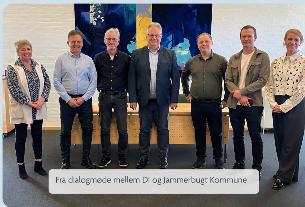
Fra dialogmøde mellem DI og Jammerbugt Kommune

Der er dog også områder, hvor tilfredsheden er knap så stor - for eksempel i forhold til indsatsen med at tiltrække og sikre kvalificeret arbejdskraft.