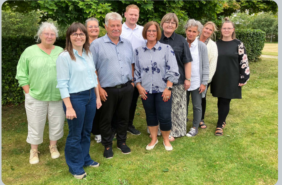
En samling af medarbejderne i Økonomiafdelingen, Central Stab