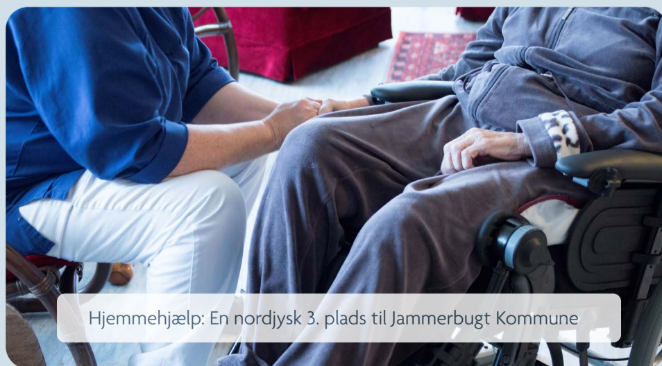
Hjemmehjælp: En nordjysk 3. plads til Jammerbugt Kommune