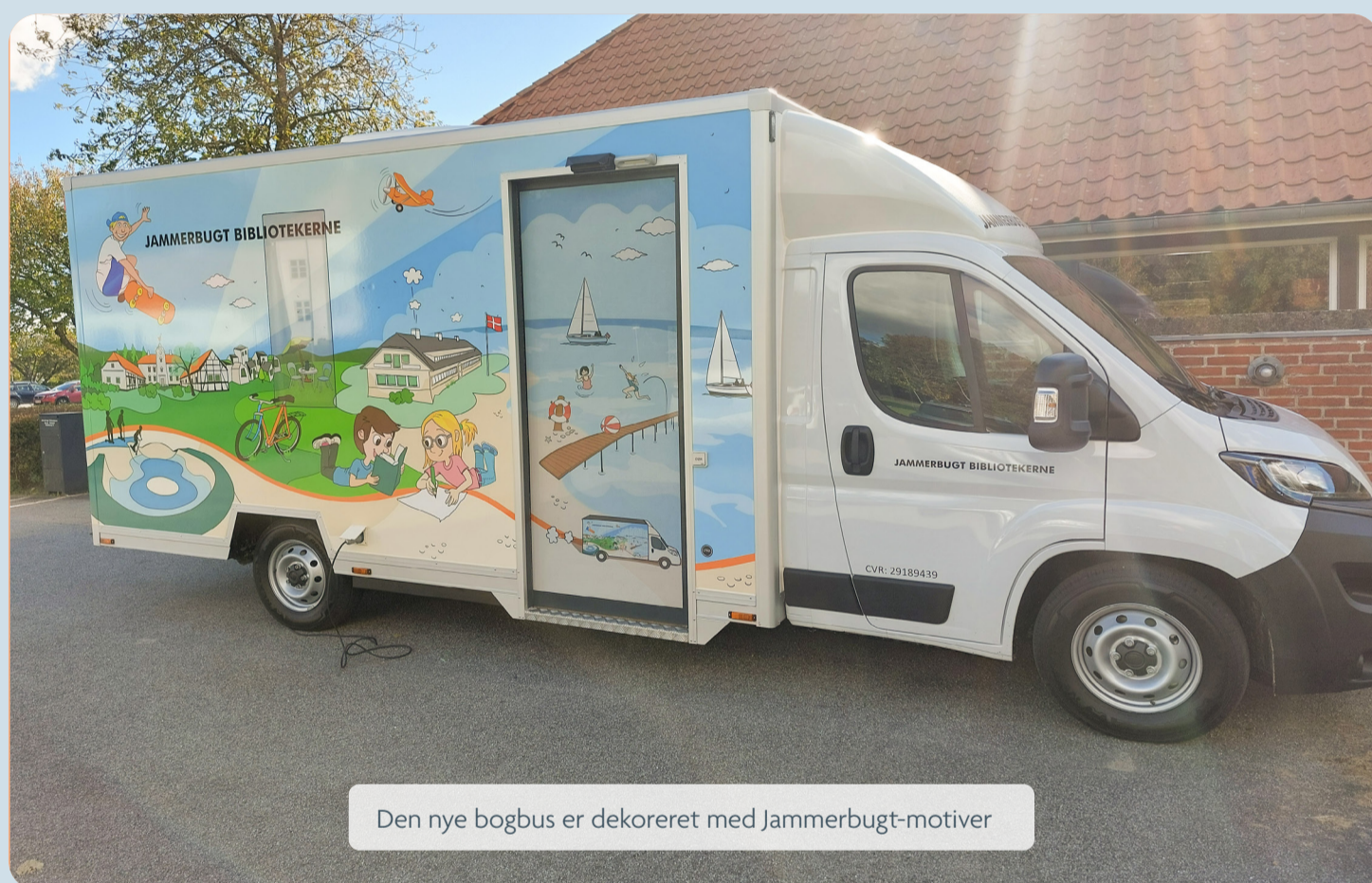
Den nye bogbus er dekoreret med Jammerbugt-motiver

Læs hvordan du gør på: https://tryk.jammerbugt.dk/media/zcblvww1/