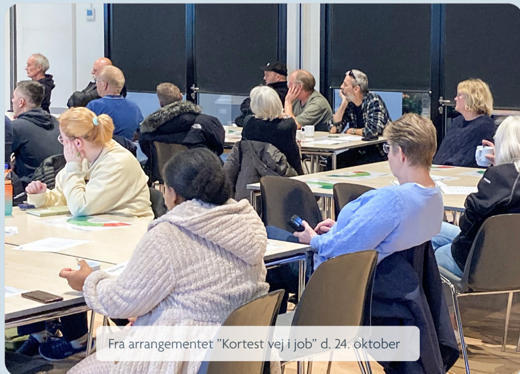
Fra arrangementet "Kortest vej i job" d. 24. oktober

Et arrangement som "Korteste vej i job" er en ny måde at klæde jobsøgende på - som en afveksling til de sædvanlige informationsmøder på jobcentret.