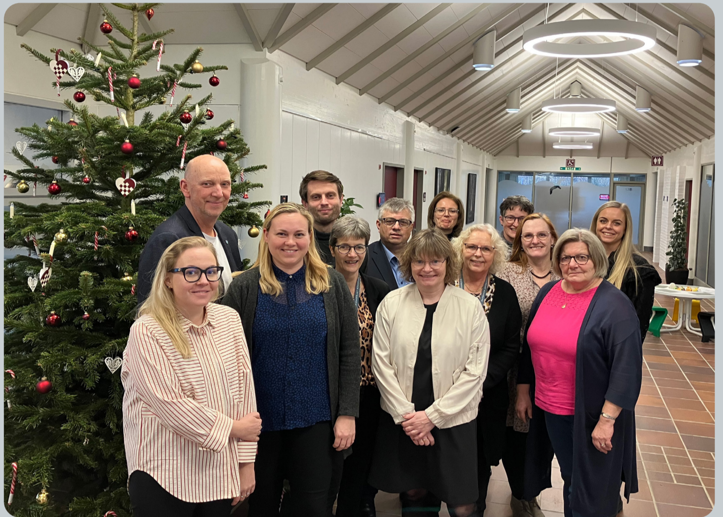
Sekretariat, Kommunikation og Udvikling holder til på rådhuset i Aabybro

I afdelingens kommunikationsteam arbejdes blandt andet med kommunens sociale medier, hjemmeside, vores intranet TRYK og presseaktivitet.