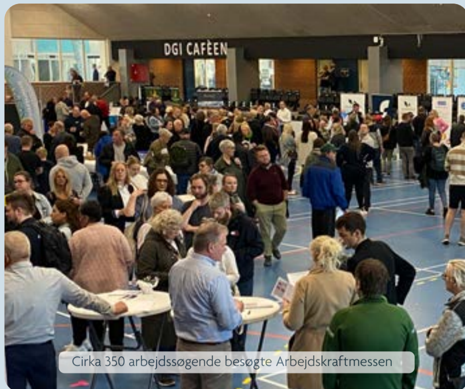
Cirka 350 arbejdssøgende besøgte Arbejdskraftmessen

Arbejdskraftmessen var den tredje af sin slags. Den første fandt sted i 2019 og efter to år med coronanedlukninger blev konceptet genoptaget sidste år.