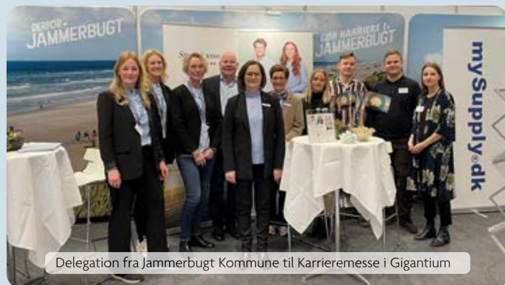
Delegation fra Jammerbugt Kommune til Karrieremesse i Gigantium

De fleste deltagere på Karrieremessen i Gigantium var kandidater eller havde udsigt til at blive det. De tænkte derfor i jobåbninger, praktiksted eller studieaktivitet og var interesserede i at høre, hvad man laver i en kommune, hvordan man får en studiepraktik i stand eller på hvilke områder, der er praktikpladser.