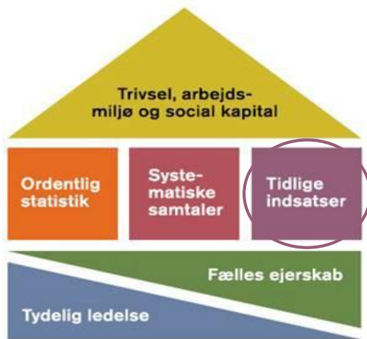
Seks elementer i en effektiv sygefraværsindsats