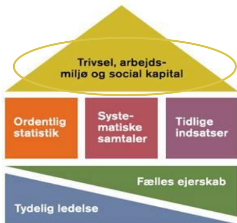
Seks elementer i en effektiv sygefraværsindsats