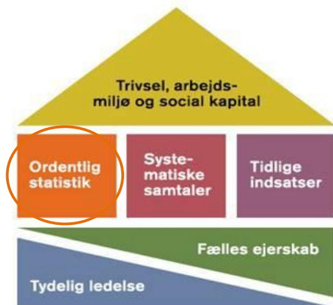
Seks elementer i en effektiv sygefraværsindsats