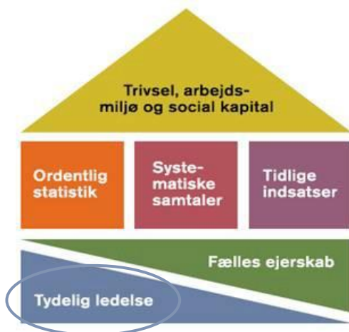
Seks elementer i en effektiv sygefraværsindsats