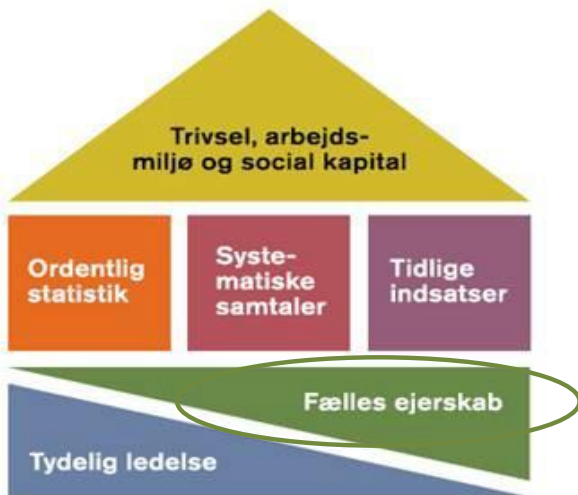
Seks elementer i en effektiv sygefraværsindsats