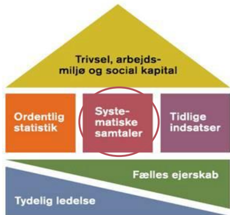
Seks elementer i en effektiv sygefraværsindsats